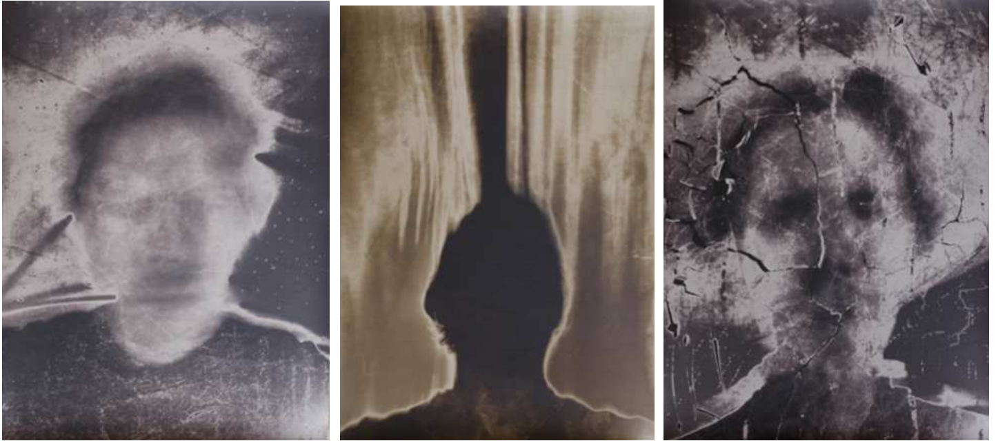
Série "Anti-Portraits" , tirages argentiques, 35 x 28 cm, 2003-2004.

"Anti-portrait-16", "Anti-portrait-18", "Anti-portrait-17"