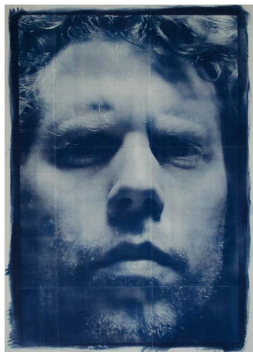
Série "Cyan-Portraits", "Untitled 01-08" , cyanotype, 51 x 66 cm, 2008. "Untitled-06", "Untitled-06"

Alors qu'il était contraint de travailler avec des matériaux assez basiques quand il vivait dans une île grecque, Michael McCarthy a été fasciné par les images imprécises et d'aspect crayeux qu'il obtenait en utilisant des négatifs de basse qualité combinés avec les cyanotypes. Rappelant un signal radio vacillant, ces images irrégulières et rêches paraissent à leur tour provenir d'un monde lointain et inconnu.