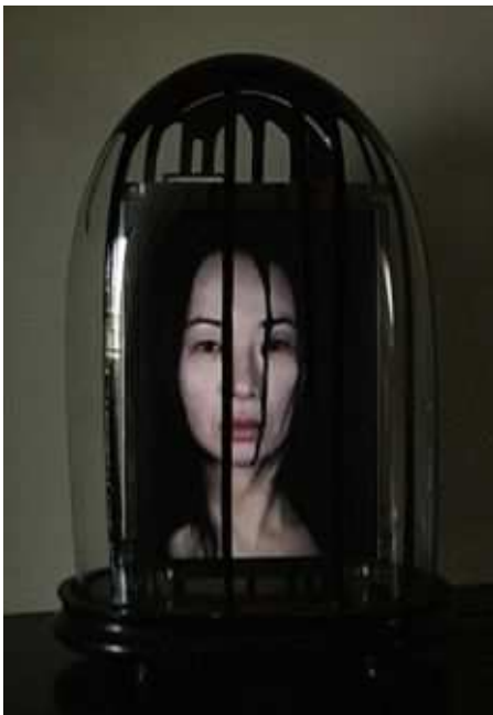
"Portrait à l'encre", objet vidéo, 5', 2011 38x27x15,5cm