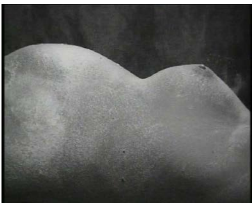
Série "Le corps en morceaux": "Baby powder", vidéo, 3'41, 1998/2006